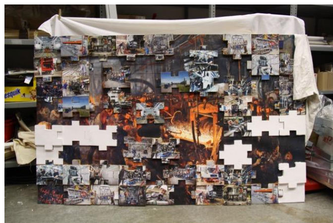
Neuinterpretation von Adolf Menzels Eisenwalzwerk