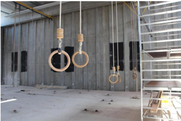
Einblick in unsere Turnhallen während der Sanierung